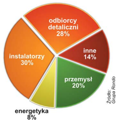
STRUKTURA ODBIORCÓW GRUPY RONDO